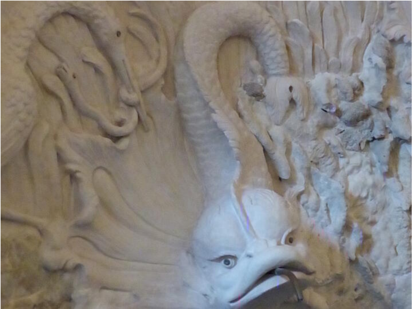
Visite guidée Saint-Antoine au fil du temps - Le temps de la curiosité : curiosités minérales ou a 38160 Saint-Antoine-l'Abbaye

Visite permettant de découvrir des espaces qui ne sont pas ouverts au public.