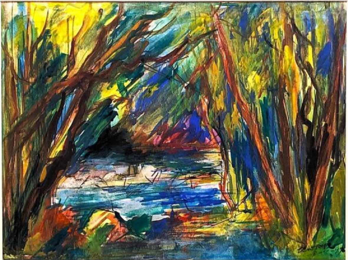
Exposition permanente du peintre Bob Ten Hoope 38160 Beauvoir-en-Royans