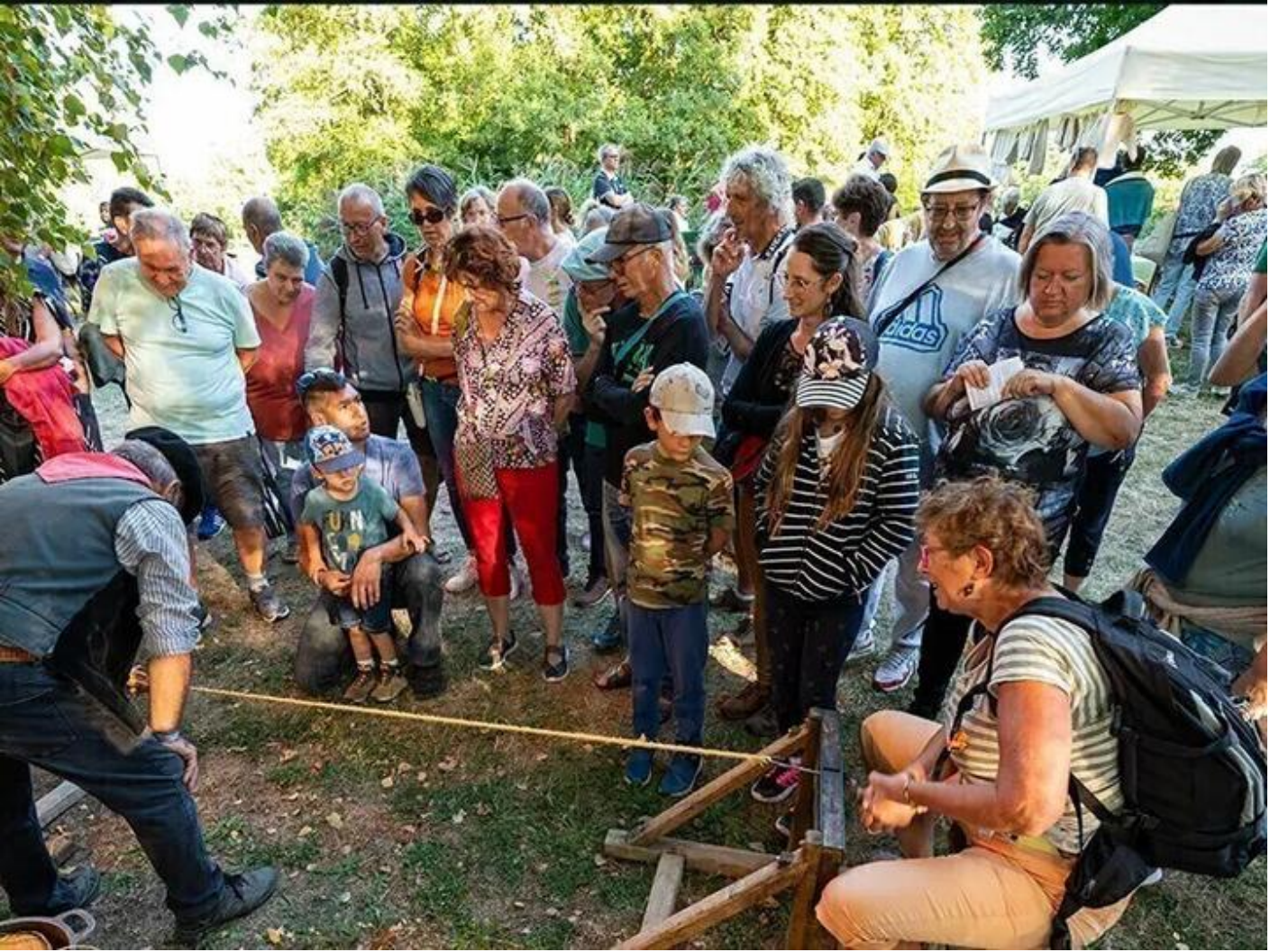
Grande fête populaire / Festival Berlioz 38160 Beauvoir-en-Royans

Le Festival Berlioz donne rendez-vous aux petits et aux grands pour une grande journée festive dans le cadre historique du Couvent des Carmes à Beauvoir-en-Royans.